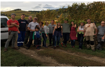
Equipe des vendangeurs 2019